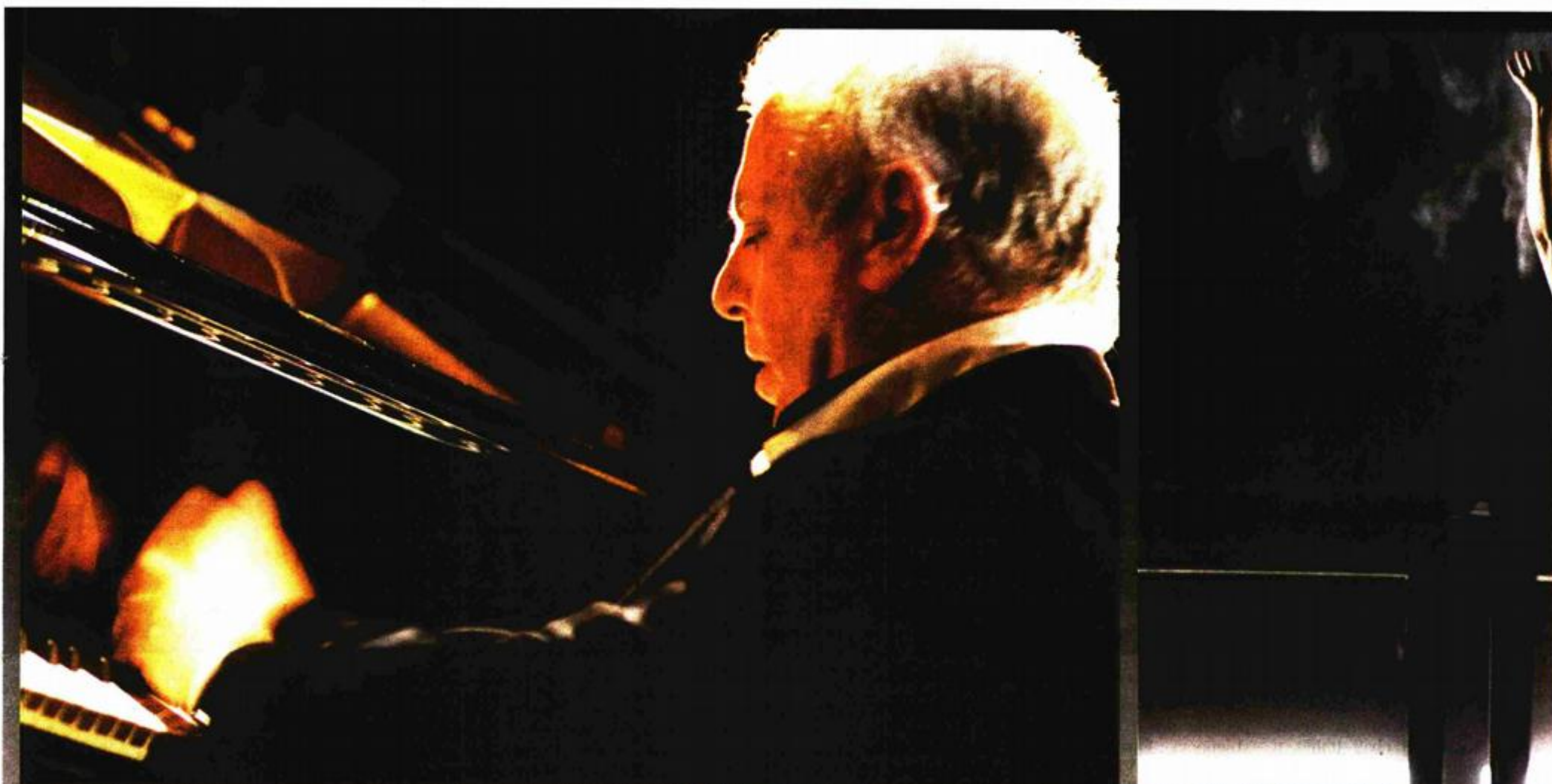
U glazbenom dijelu programa najveća je zvijezda Festivala legendarni dirigent i pijanist Daniel Barenboim, a slovenski redatelj Tomaž Pandur postavlja 'Medeju' s Almom Pricom