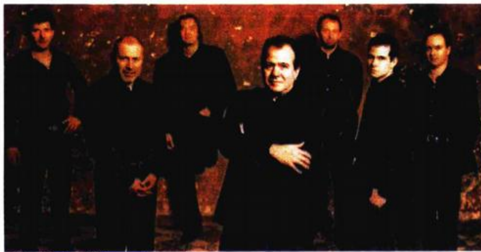
Richard Galliano i Piazzola Forever Septet