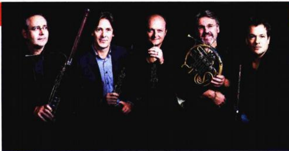
Les Vents Français

Uz folklorne ansamble Lindo i Lado, na Igrama će gostovati i Budva grad teatar s baletom "Božanstvena komedija" u koreografiji Edwarda Cluga. U suradnji s Noir Festivalom, u palači Sponza otvorit će se izložba fotografija "Double Identity" Saše Sekoranje, a u Kneževu dvoru bit će predstavljena monografija glumačke legende hrvatskog kazališta – Pere Kvrgića.