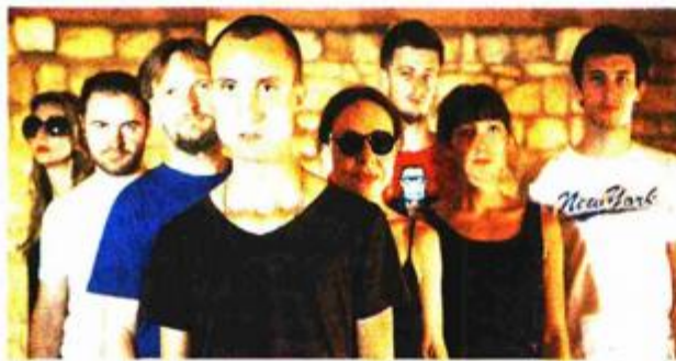
Ansambel predstave u Lazaretima

- Mnogi su mi tako pričali o rukama Izeta Hajdarhodžića, ali nitko nije