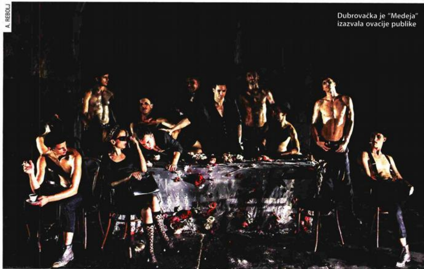
Dubrovačka je "Medeja" izazvala ovacije publike