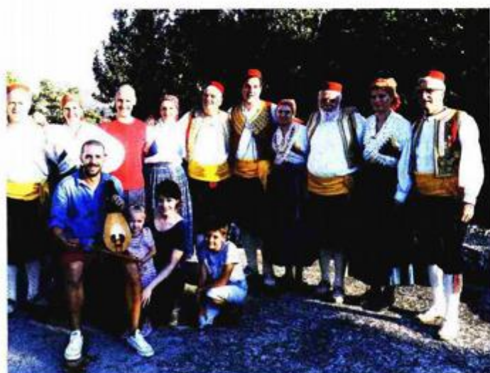
Zabalao se i Lindo