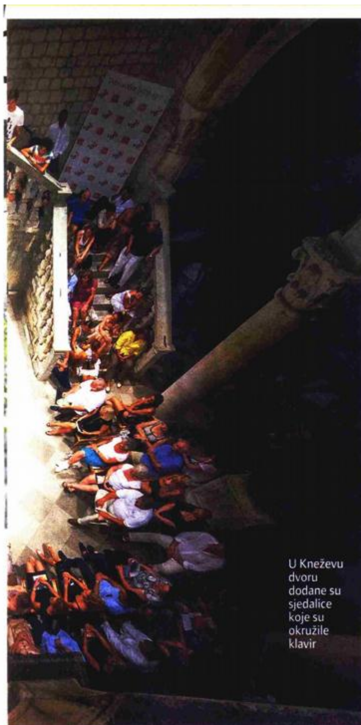
U Kneževu dvoru dodane su sjedalice koje su okružile klavir

u Kneževu dvoru na nogama je ispratila maestrov nastup zahvalivši mu dugotrajnim pljeskom i ovacijama.