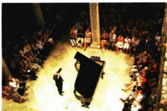
Daniele Barenboim zahvaljuje brojnoj publici u Dvoru