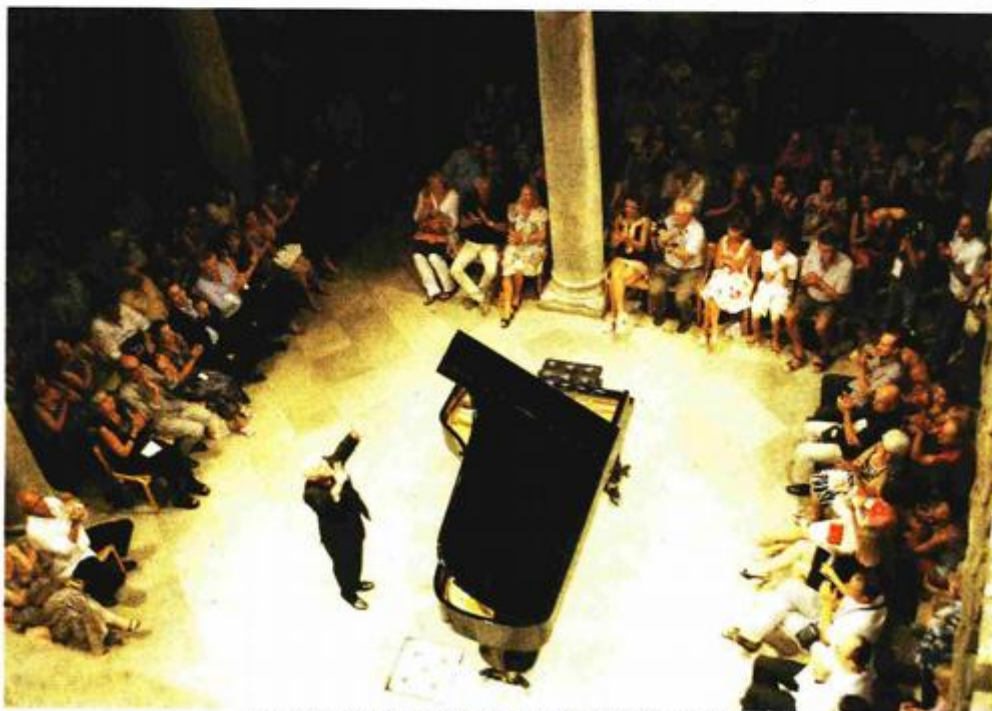
Daneile Barenboim zahvaljuje brojnoj publici u Dvoru

Nakon nastupa na čuvenom Salzburškom festivalu s djelima Franza Schuberta maestro je i u Dubrovniku oduševio golemo mnoštvo s