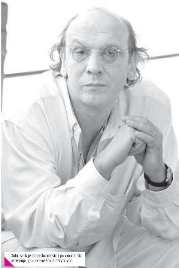
Dubrovnik je istorijsko mesto i po onome što ostvaruje i po onome što je ostvarivao

sukreator, a ne pasivni promotor. Interakcija kulturnog megalopolisa, koji ne poznaje granice ni nacionalne, ni verske, ni ove, ni one jeste nešto što vredi negovati, a što se i te kako temelji u tradiciji. Verujem da se radi o umet-