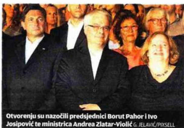
Otvorenju su nazočili predsjednici Borut Pahor i Ivo Josipović te ministrica Andrea Zlatar-Viočić.