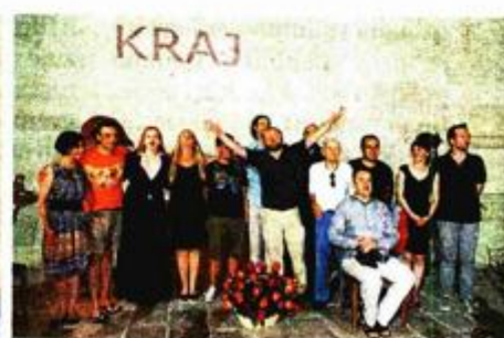
Nakon 'sjednice' na kojoj je publika izmiješana s glumcima, predstava se seli ispred Vijećnice gdje je napravljeno nekoliko društvenih kružoka