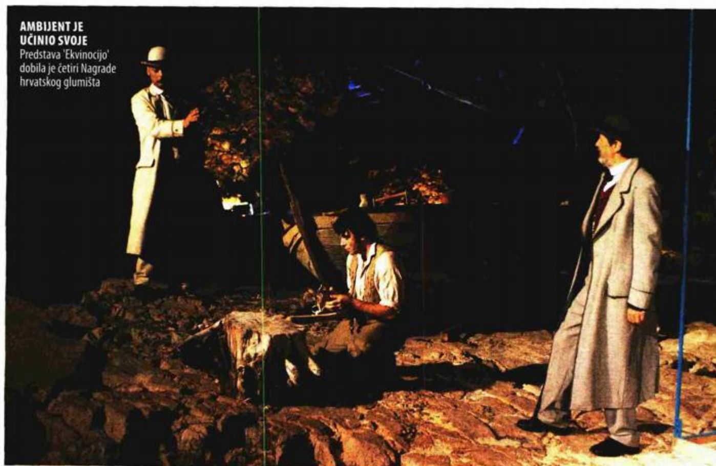
AMBIJENT JE UČINIO SVOJE Predstava 'Ekvinocijo' dobila je četiri Nagrade hrvatskog glumišta

Jedan od najcjenjenijih kazališnih redatelja Joško Juvančić na Dubrovačkim ljetnim igrama obnavlja svoju legendarnu predstavu 'Ekvinocijo', a izvodit će se od 4. do 7. kolovoza