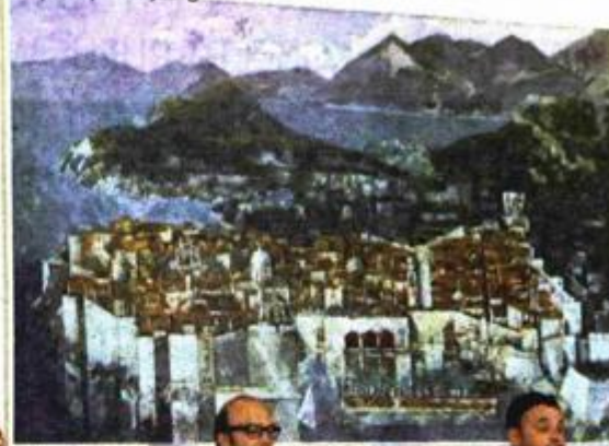
Glumci-vijećnici pred stolom predsjedavajućeg

sredan način ostvaruje komunikaciju s gledateljima, uvlačeći ih nenametljivo u događaj, što je posvjedočeno drugim, završnim dijelom predstave i druženjem s glumcima pred zgradom Vijećnice. Zanimljiva pred-