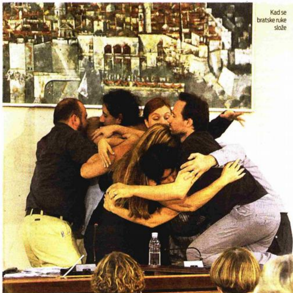
Kad se bratske ruke slože

"...Naš Allons enfants" reagira veoma blago i distancirano na Vojnoviće, gotovo kao nekakav obol Dubrovniku i takvome prikazu vlasti. Naposljetku ova naša predstava je reakcija na cjelokupnu stvarnost u kojoj živimo, ne samo dubrovačku."