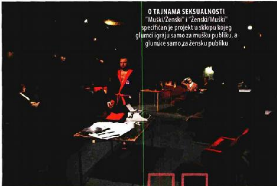
O TAJNAMA SEKSUALNOSTI "Muški/Zenski" i "Ženski/Muški" specifičan je projekt u sklopu kojeg glumci igraju samo za mušku publiku, a glumice samo za žensku publiku

u životu. Pri tom on uglavnom dolazi do uvida da mu se ništa ne događa, jer kada se zapita „Što mi se to dogodilo?“, misleći na nešto loše, čovjek zapravo priziva svoju paralelnu realnost. Osobi koja je pala cigla na glavi, očito nije određeno da dobije milijun eura na lutriji, već mu je suđeno da prođe „užom“ životnom ulicom. Kazalište je svjedočanstvo smrti trenutka i podsjećanje da smo započeli umirati nakon trenutka u kojem smo se rodili.