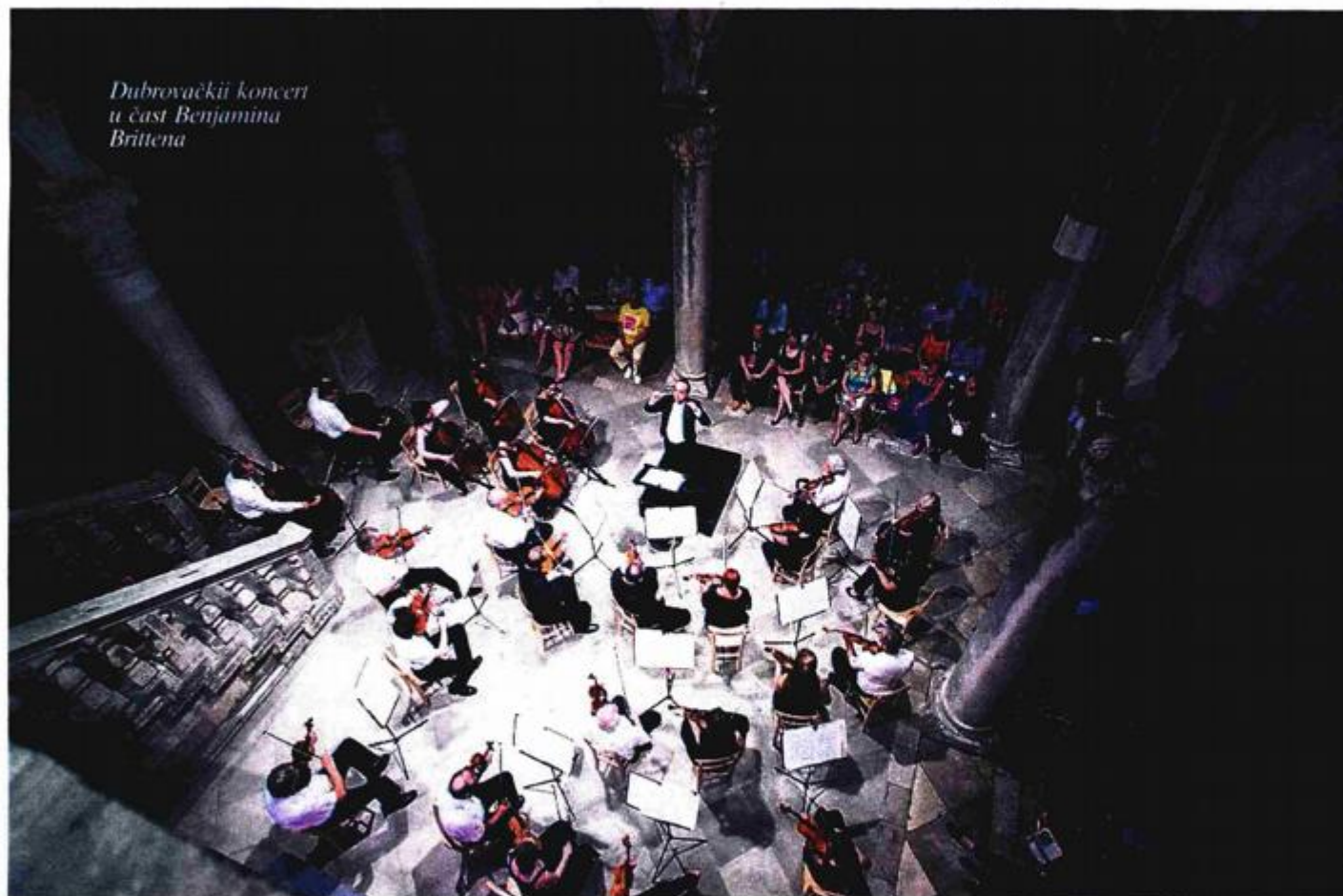
Dubrovački koncert u čast Benjamin Brittena

E dward Benjamin Britten, britanski skladatelj, pijanist i dirigent, rođen je 22. studenoga 1913. u Lowestoftu (Suffolk), a preminuo je 4. prosinca 1976. u Aldeburghu. Ove godine u Velikoj Britaniji i svijetu obilježava se stota godišnjica njegova rođenja, čemu se pridružuje i Hrvatska.