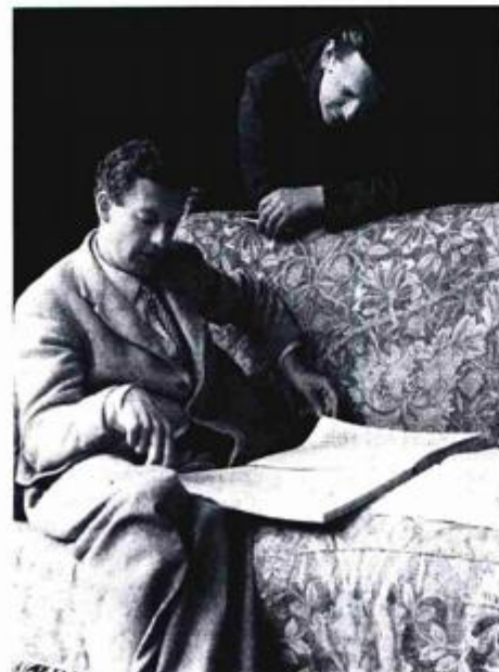
Suradnici i ljubavnici – Benjamin Britten i Peter Pears

S totoj obljetnici rođenja Benjamin Brittena pridružuju se i riječki HNK Ivana pl. Zajca te HNK Šibenik, koji u koprodukciji pripremaju Brittenov »The Turn of the Screw/Okretaj zavrtnja«. Riječ je o komornoj operi za koju libreto potpisuje Myfanwy Piper. Opera je naručena za Venecijanski bijenale, a svjetska premijera izvedena je 14. rujna 1954. godine u venecijanskom Teatro La Fenice