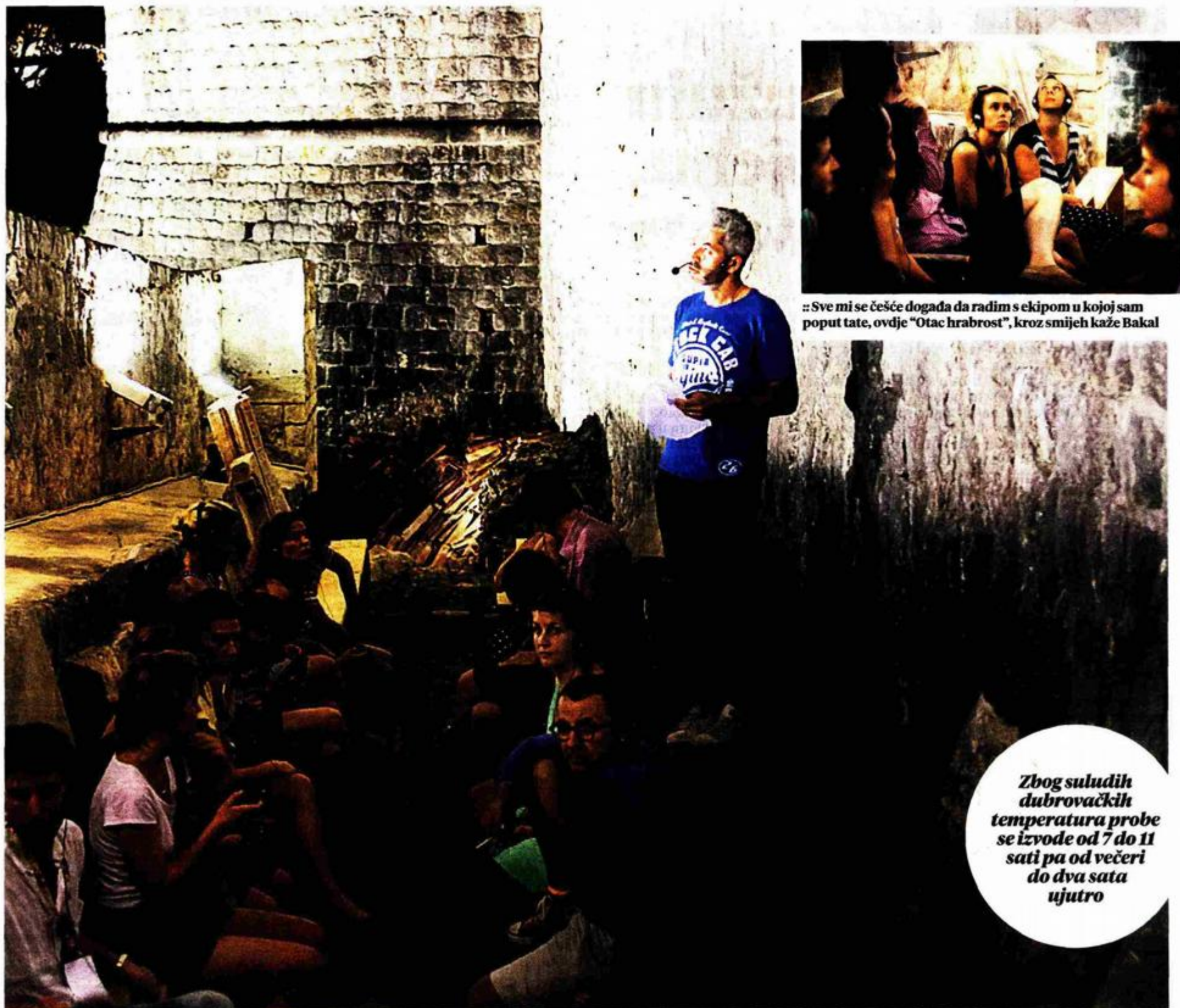
„Sve mi se češće događa da radim s ekipom u kojoj sam poput tate, ovdje "Otac hrabrost", kroz smijeh kaže Bakal

Zbog suludih dubrovačkih temperatura probe se izvode od 7 do 11 sati pa od večeri do dva sata ujutro