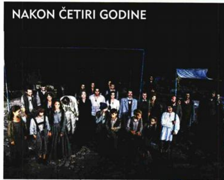
NAKON ČETIRI GODINE