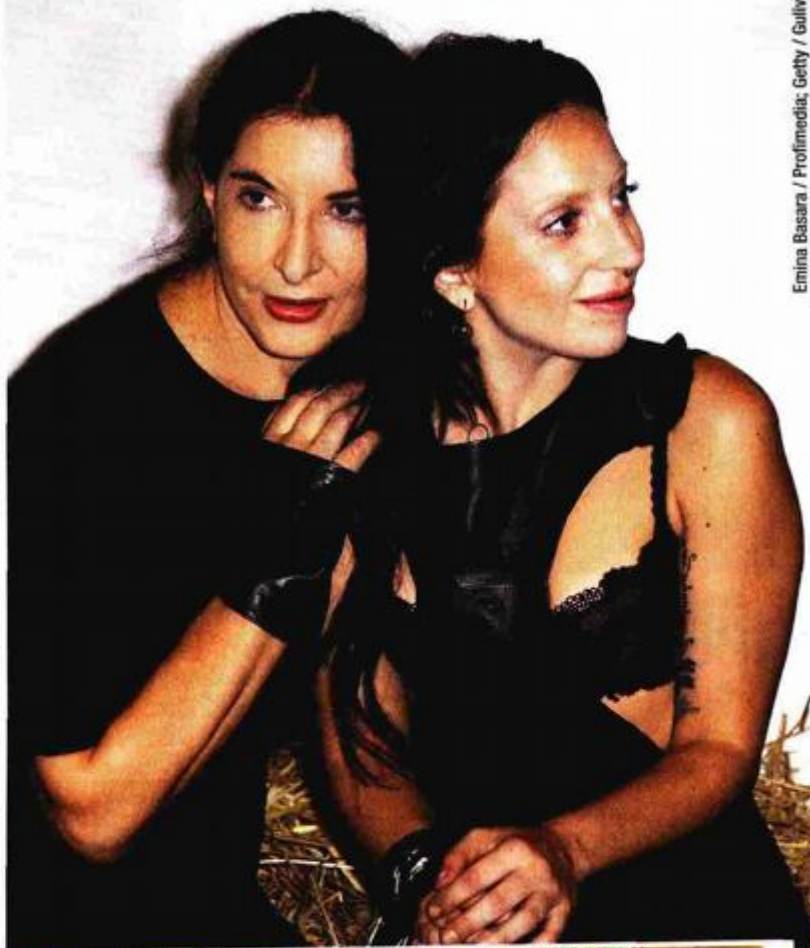
Emina Basara / Profimedia, Getty / Gulliver

» Obožavatelji su se već odavno naviknuli pjevačicu Lady Gagu gledati u avangardnim kostimima, a sada će je prvi put vidjeti bez ičega, i to radi umjetnosti. Naime, 27-godišnja glazbenica snimila je dvominutni video performans u kojem gola šee livadom i šumom te grli divovski kristal koji je nazvala 'The Abramovic Method Practiced by Lady Gaga'. Filmić je prošli tjedan preplavio internet, a njime Gaga želi pomoći svojoj novoj prijateljici, njujorškoj performerici Marini Abramović , podrijetlom iz Srbije, da skupi novac za otvorenje svog instituta